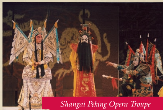
Shanghai Peking Opera Troupe

Los actores utilizan un elaborado maquillaje o máscaras. Entre los instrumentos se incluyen el laúd de arco y el punteado, tambores, campanas, gongs, címbalos, flautas de bambú y oboes.