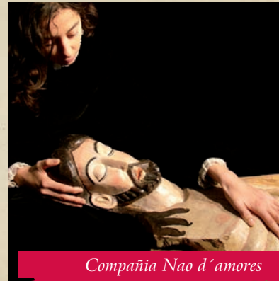
Compañía Nao d'amores

A través de una dramaturgia realizada a partir de textos históricos de diversa procedencia, mediante la investigación e interpretación en directo de piezas musicales que pudieron articular una ceremonia de este tipo, se desarrolla una puesta en escena que combina el trabajo actoral con el teatro de títeres, y que supone un acercamiento a los orígenes del teatro moderno. Un viaje al final de la Edad Media para transitar un microcosmos construido a base de símbolos, figuras alegóricas y metáforas, en el que cada parte está en función de un todo.