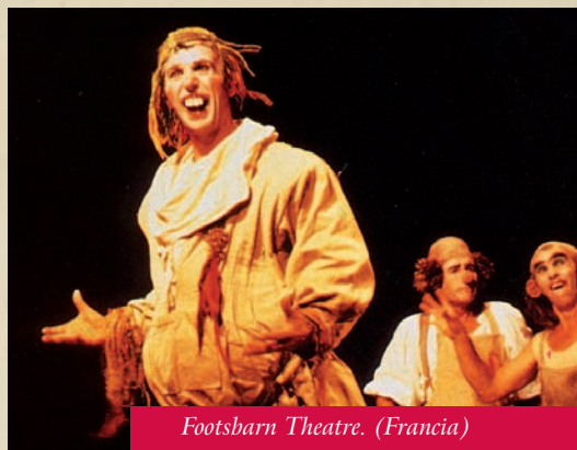
Footsbarn Theatre. (Francia)

El carnavalesco Sueño de una noche de verano creado por Footsbarn Théâtre es un mundo en sí mismo; de hecho, la compañía es un festival en sí misma, una increíble combinación de estilos e influencias, de nacionalidades y de culturas, en la que todo se mezcla en un inverosímil torrente de puro teatro. El norte, el sur, el este y el oeste se conjugan en esta producción donde se encuentran payasos, desfiles de carnaval, danzas tribales, Kabuki, Comedia del Arte, farsa y surrealismo, en torno a un sentido único de maravilla, de placer y de magia.