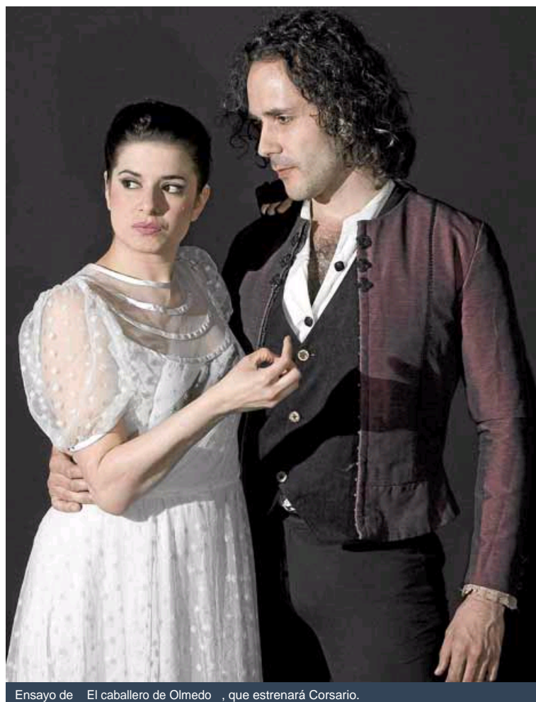
Ensayo de El caballero de Olmedo, que estrenará Corsario.

El IV festival se celebrará del 17 al 26 de julio